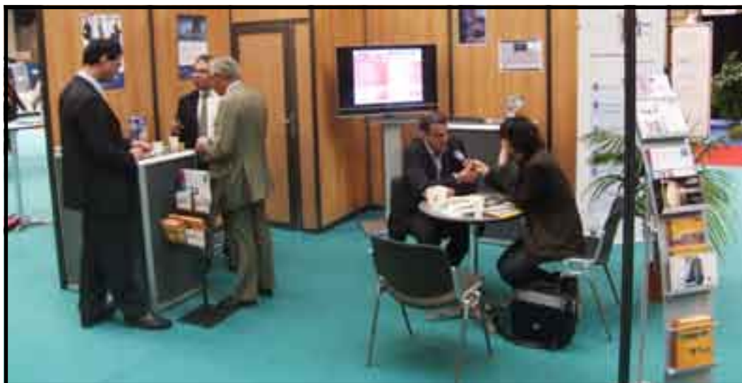
FISTEXPO Le salon de référence dans l'Est